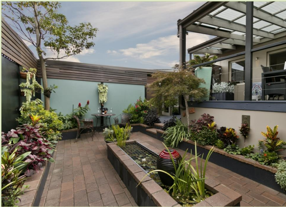
Diseño y ejecución de terraza ático en vivienda unifamiliar. Ibiza.