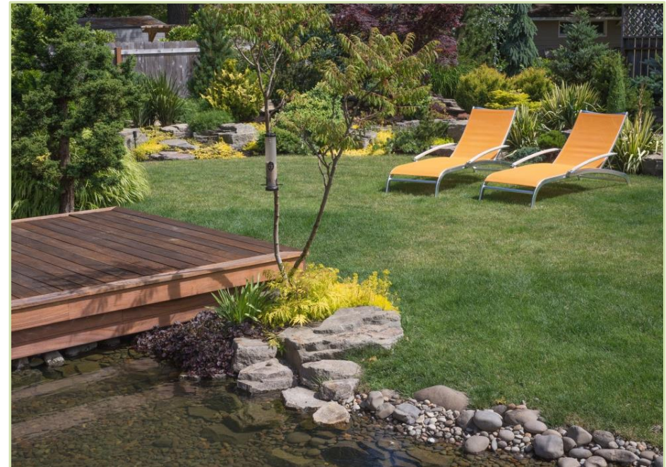
Diseño y ejecución de jardín con piscina naturalizada. Barcelona.