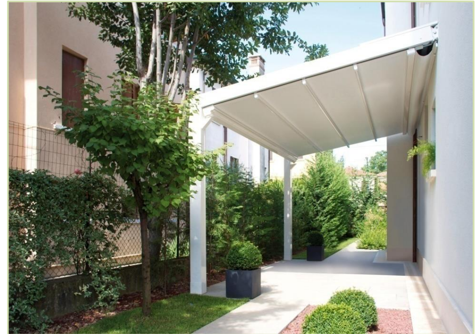
Diseño e instalación de pérgola de aluminio Alicante.