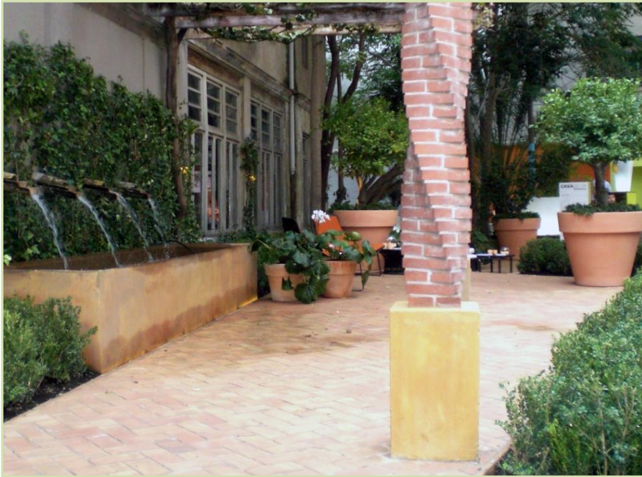
Diseño y ejecución de espacio efímero. Casa Decor, Valencia.