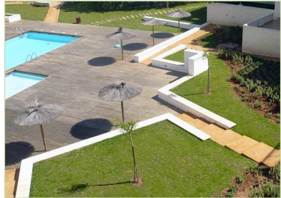
Diseño y ejecución de urbanización y zonas verdes. Denia, Alicante.