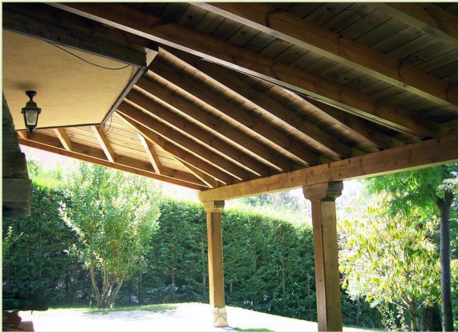
Diseño e instalación de pérgola de madera. Valencia.