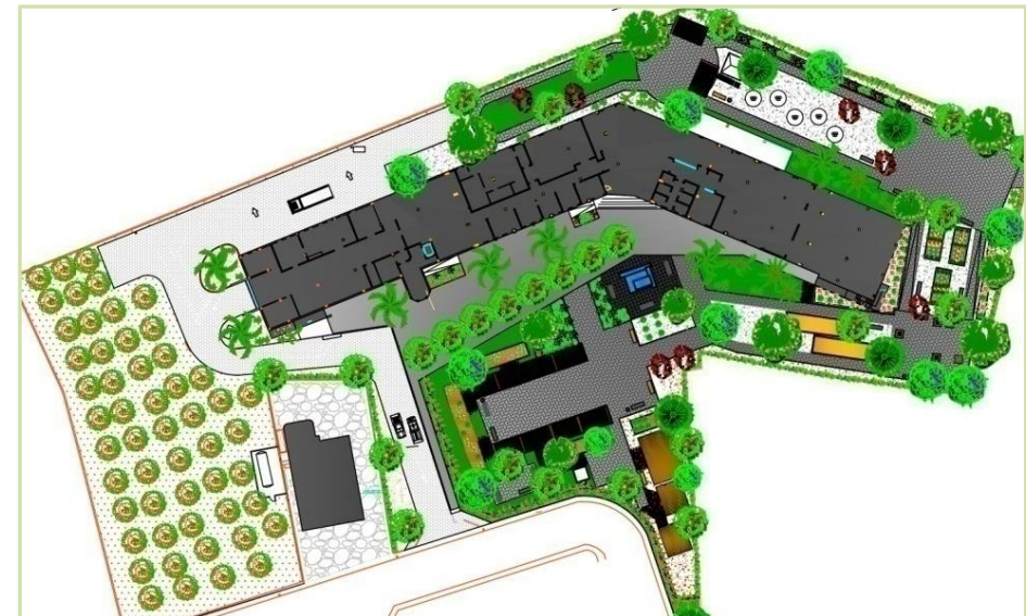
Proyecto paisajismo. Residencia. Quartell, Valencia.