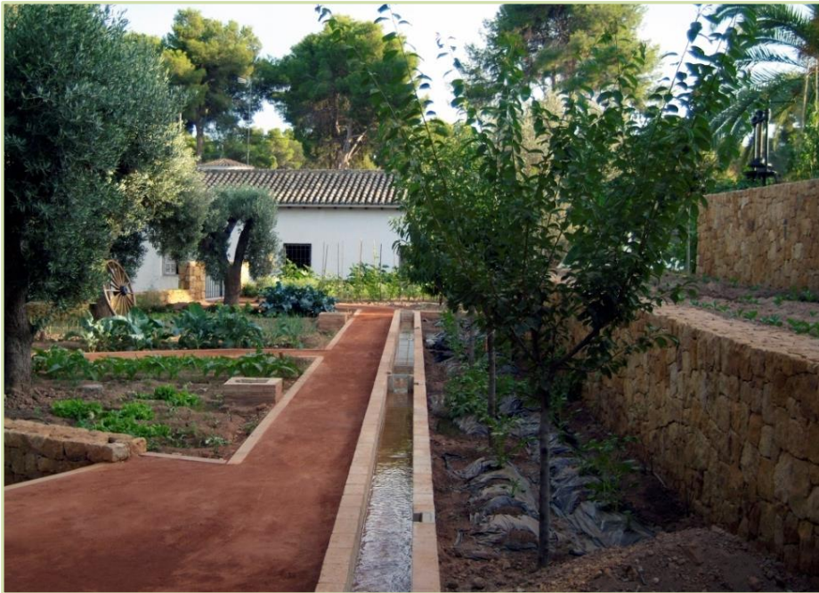
Diseño y construcción de acequia y huerto en vivienda privada Campolivar, Valencia.