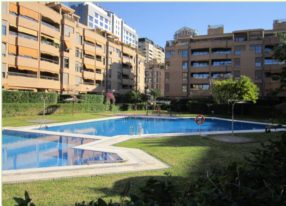
Mantenimiento integral Cdad. Vecinos Marina Alta 6. Valencia (zona Cortes Valencianas)