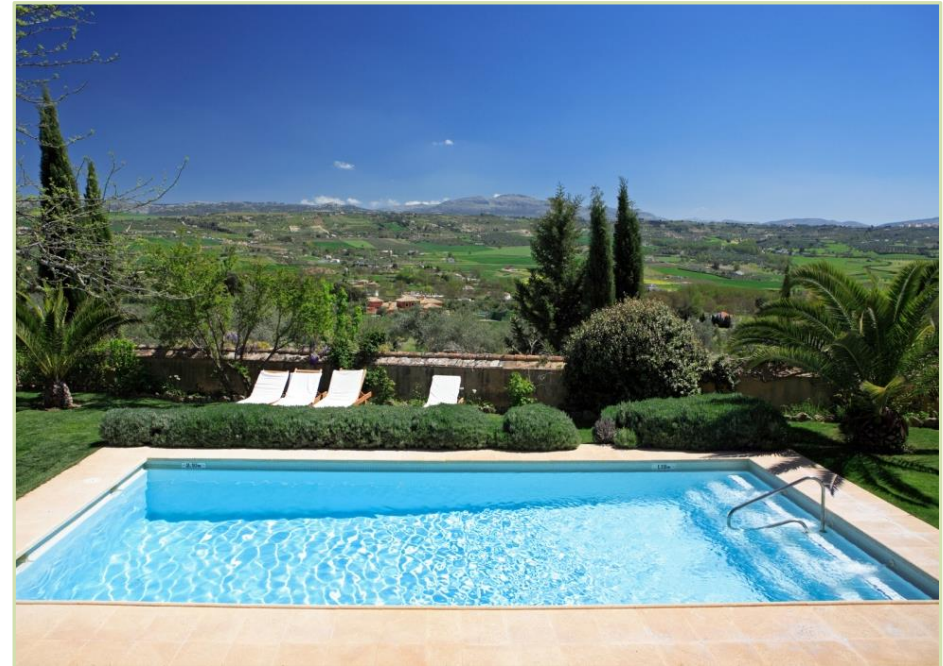
Diseño y ejecución de piscina privada y jardín. Castellón.