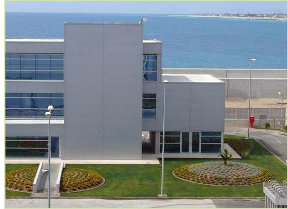
Diseño y ejecución de zonas exteriores, 5.000 m 2 Infinita Renovables, Castellón.