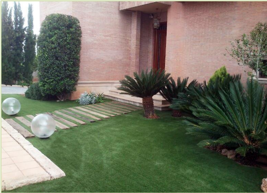
Instalación de césped artificial vivienda particular. 1500 m2 Valencia.