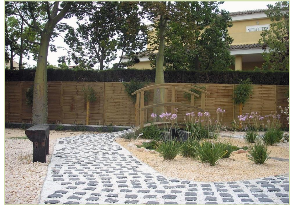
Diseño y ejecución de jardín. Vivienda particular. La Eliana, Valencia.