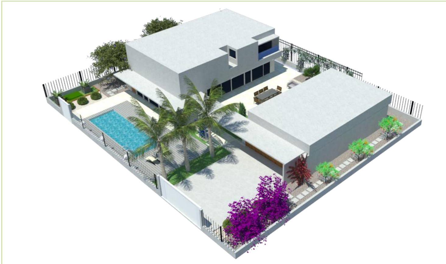
Diseño de paisajismo, vivienda particular. Valencia.